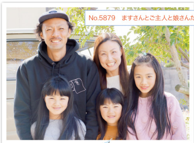
No.5879 ますさんとご主人と娘さんたち