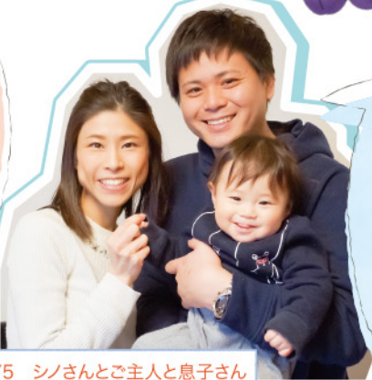
No.13575 シノさんとご主人と息子さん