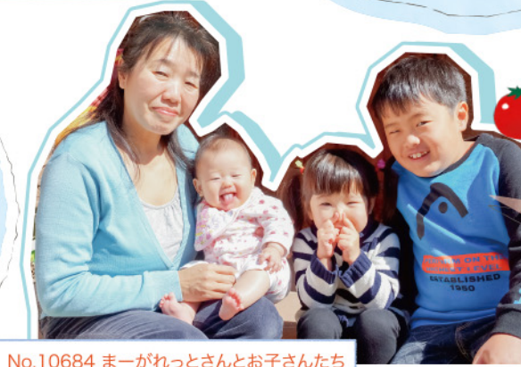
No.10684 まーがれっとさんとお子さんたち